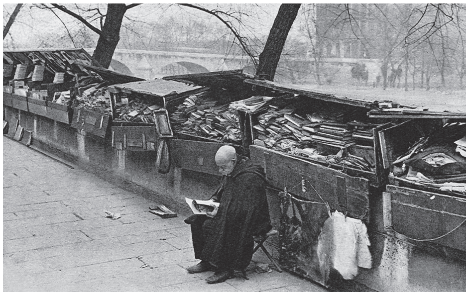
Pariisi vaade 1920.–1930. aastatest. Bukinist Seine'i ääres.