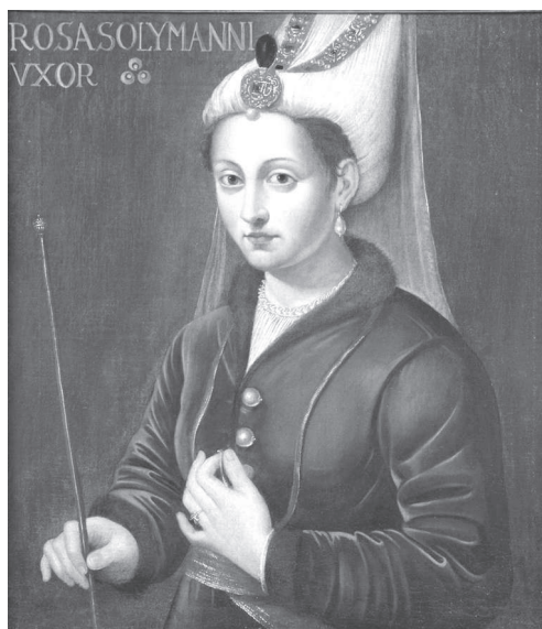
Noore Hürremi portree pealkirjaga „Roxelana, Suleimani naine“. Veneetsia koolkond, 16.–17. sajand.

Hürrem ja Suleiman purustasid traditsiooni, luues tuumikpere polügaamses maailmas. Enne seda oli monarhia konkubiinidel olnud üksainus väga spetsiifiline ülesanne. Kui konkubiin oli Osmanite printsile või sultanile sünnitanud poja, siis oli tema ainsaks edasiseks kohuseks töötada poja tulevase poliitilise edu nimel. Seesugune asjakorraldus vältis võimalikku konflikti, sest poja sünd